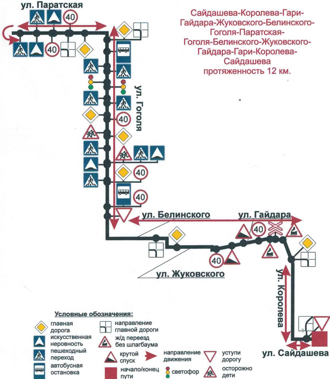
Схема учебного маршрута №2 ООО «АВТОПРАВО-М»

Сайдашева-Королева-Гари- Гайдара-Жуковского-Белинского- Гоголя-Паратская- Гоголя-Белинского-Жуковского- Гайдара-Гари-Королева- Сайдашева протяженность 12 км.