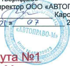
Схема учебного маршрута №1 ООО «АВТОПРАВО-М» Комарова-Королева-Столичная-Строителей протяженность 4 км.